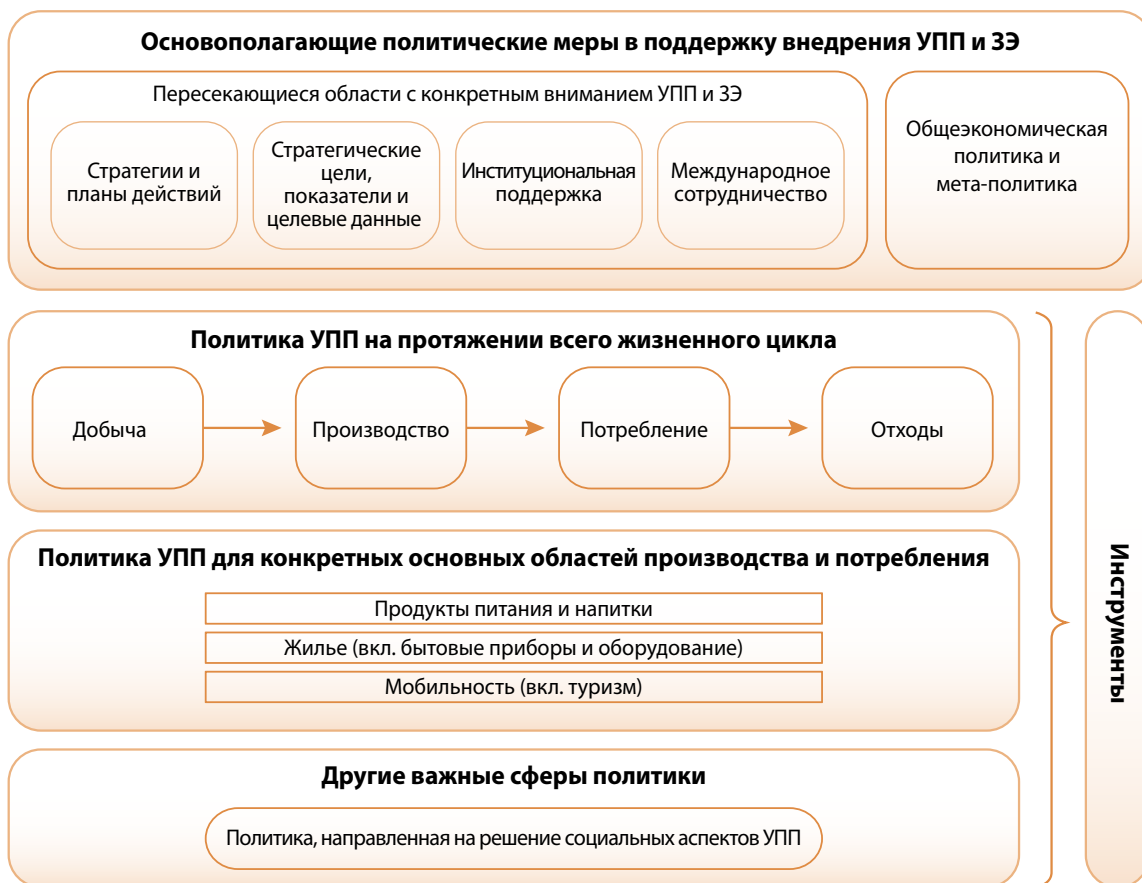
Илл. 1: Широкая структура политики УПП.

Политика и инициативы, способствующие разработке УПП, которые ведут к переходу к зелёной экономике, могут